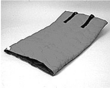
140 x 90 cm