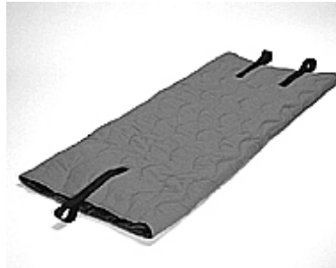
200 x 90 cm